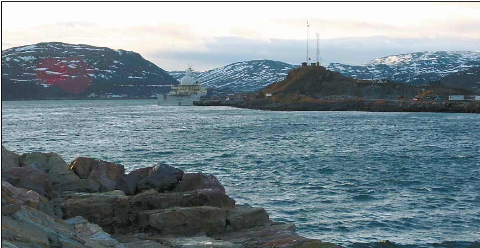
FJERNES: Storholmen vi ser i bakgrunn skal fjernes samtidig som moloene forlenges.