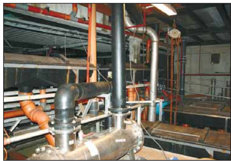
HØYTEKNOLOGI: Polar Seafood er spekket med høyteknologisk utstyr renseutstyr.

Smoltanlegget som brukes i dag er kraftig oppgradert, med blant annet et avansert vannrenseanlegg og utstyr for å sikre pro-