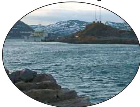
Storholmen vi ser i bakgrunn skal fjernes.