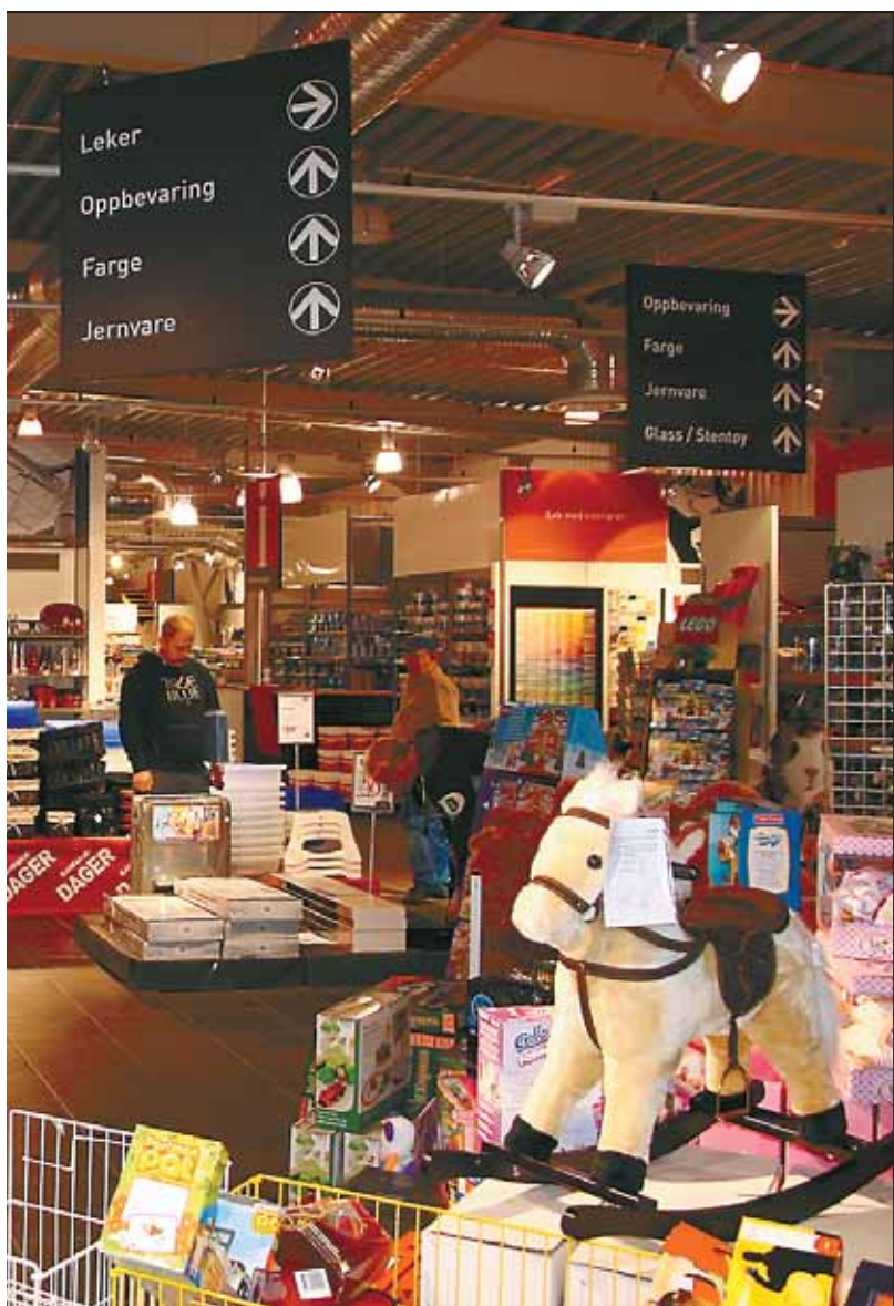
kommet i topp moderne lokaler, med blant annet en stor leketøysavde-