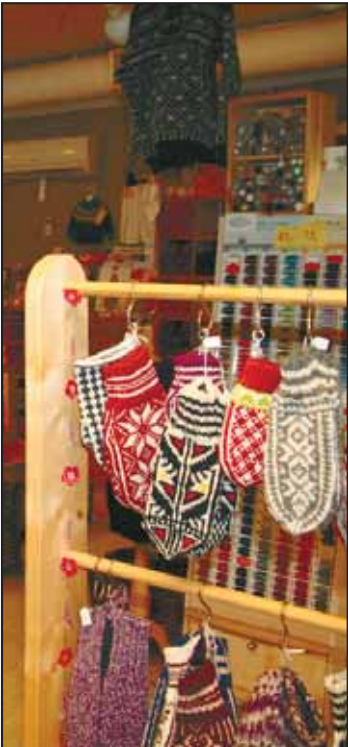
BUTIKK: I 2007 etablerte Båtsfjord Service gavebutikk og systue i sentrum av værret.