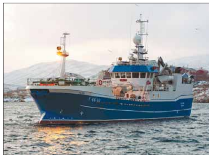
STØRST: «Kildin» er østfylkes største fiskefartøy.