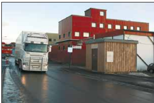
TRAILERLAST: Hver dag går en trailer med isoporkasser til Sør-Varanger.

Samsung 40" LED TV Full HD 1920x1080, 4xHDMI, RiksTV