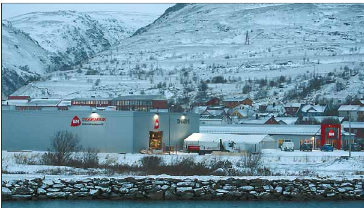
FOMA: Det er god plass på Foma til en av regionens største forretning innen sin bransje.

I dag er det 12 tilsatte ved BM/Materialhandelen AS i Båtsfjord, og forretningen leverer varer og utstyr i hele Øst-Finnmark.