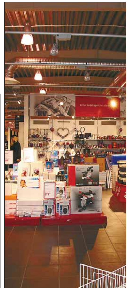
MODERNE: BM/Materialhandelen har nå i ling.

- Vi har valgt å videreføre navnet. Og har også et sortiment som nok ikke finnes i tradisjonelle BM-forretninger. Blant annet le-