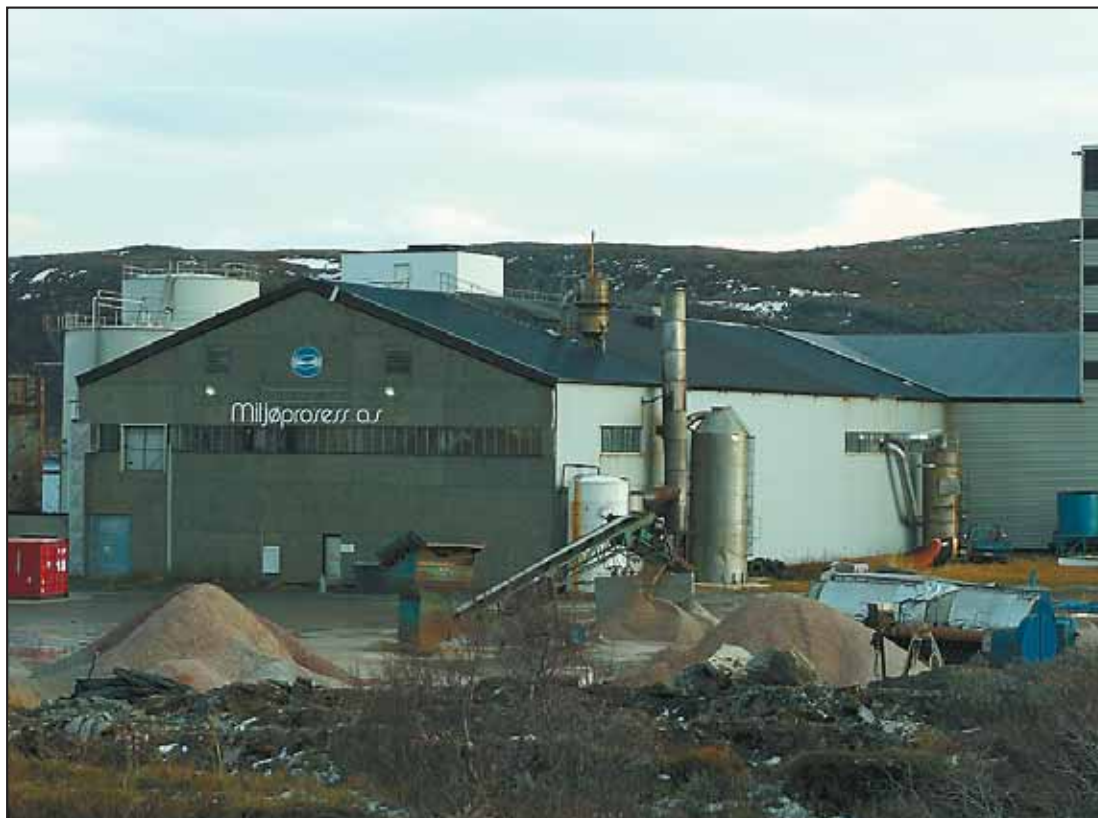
LUKTFRI: Det investeres millioner i å få Miljøprosses nærmest luktfri under produksjon.