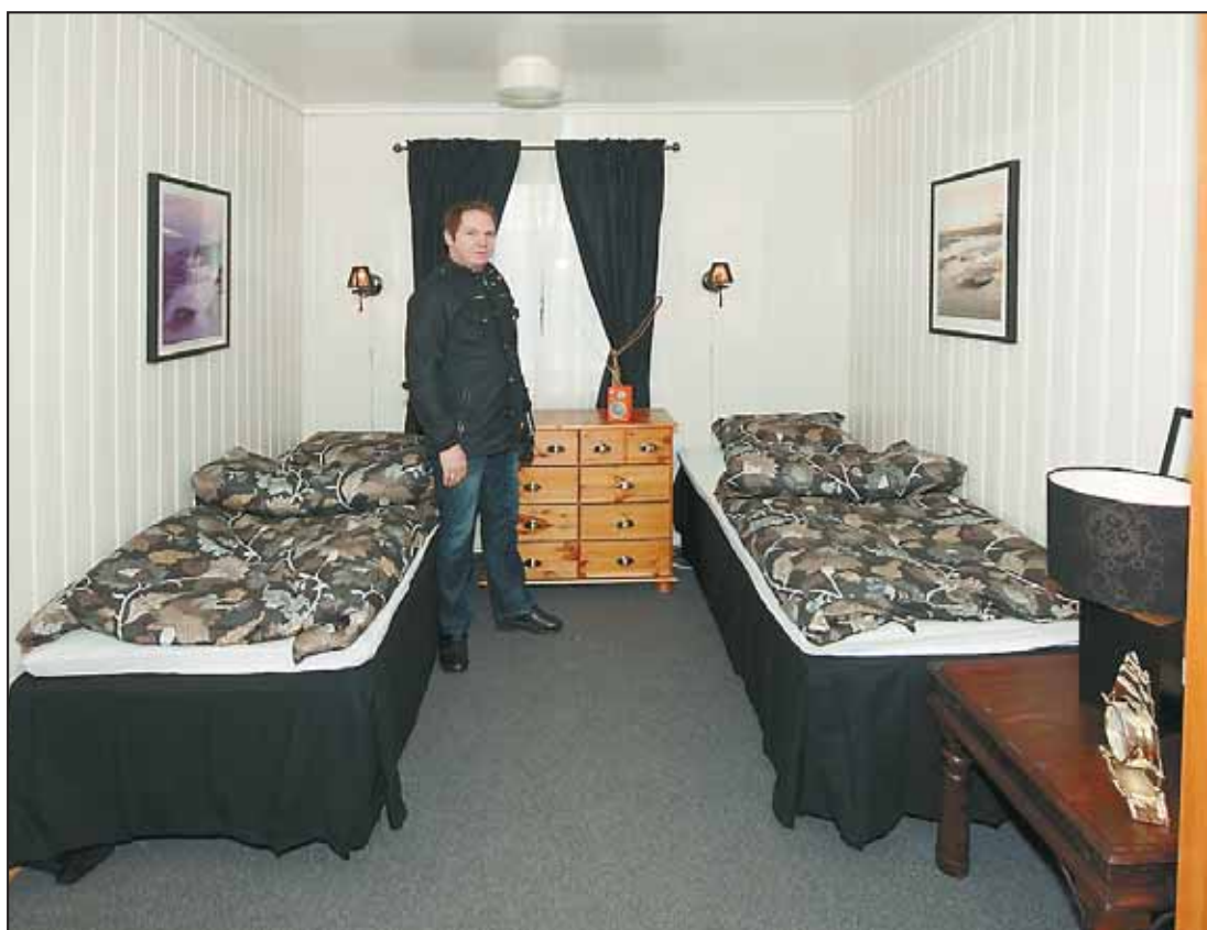
STANDARD: Arbeidene med å renovere og ombygge om lag 60 boenheter er i full gang, og alle skal holde høy standard.

si noe om på nåværende tidspunkt, sier Kjell Roger Brandshaug.