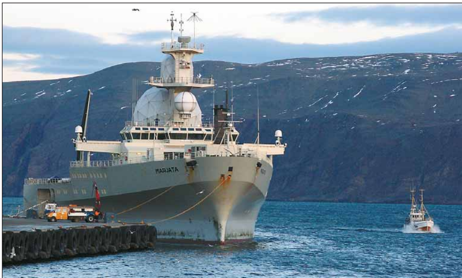
ANLØP: Båtsfjord fikk et historisk anløp da det ruvende etterretningsfartøyet «Marjata» la til kaia.

Skipet er spesialbygget for formålet og utført slik at det skal ha lav egenstøy slik at det ikke forstyrrer signaturmålinger, og har høy stabilitet slik at sensorer kan ope-