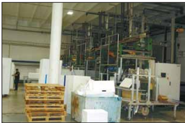
FLYTTER: Nå flyttes de store isopormaskinene fra Båtsfjord til Tana.