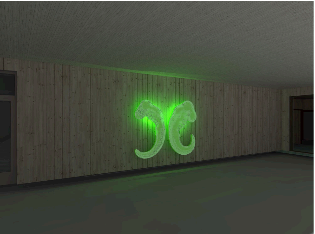
Fisk og folk, glassfiber og epoxy, RGB LED-belysning