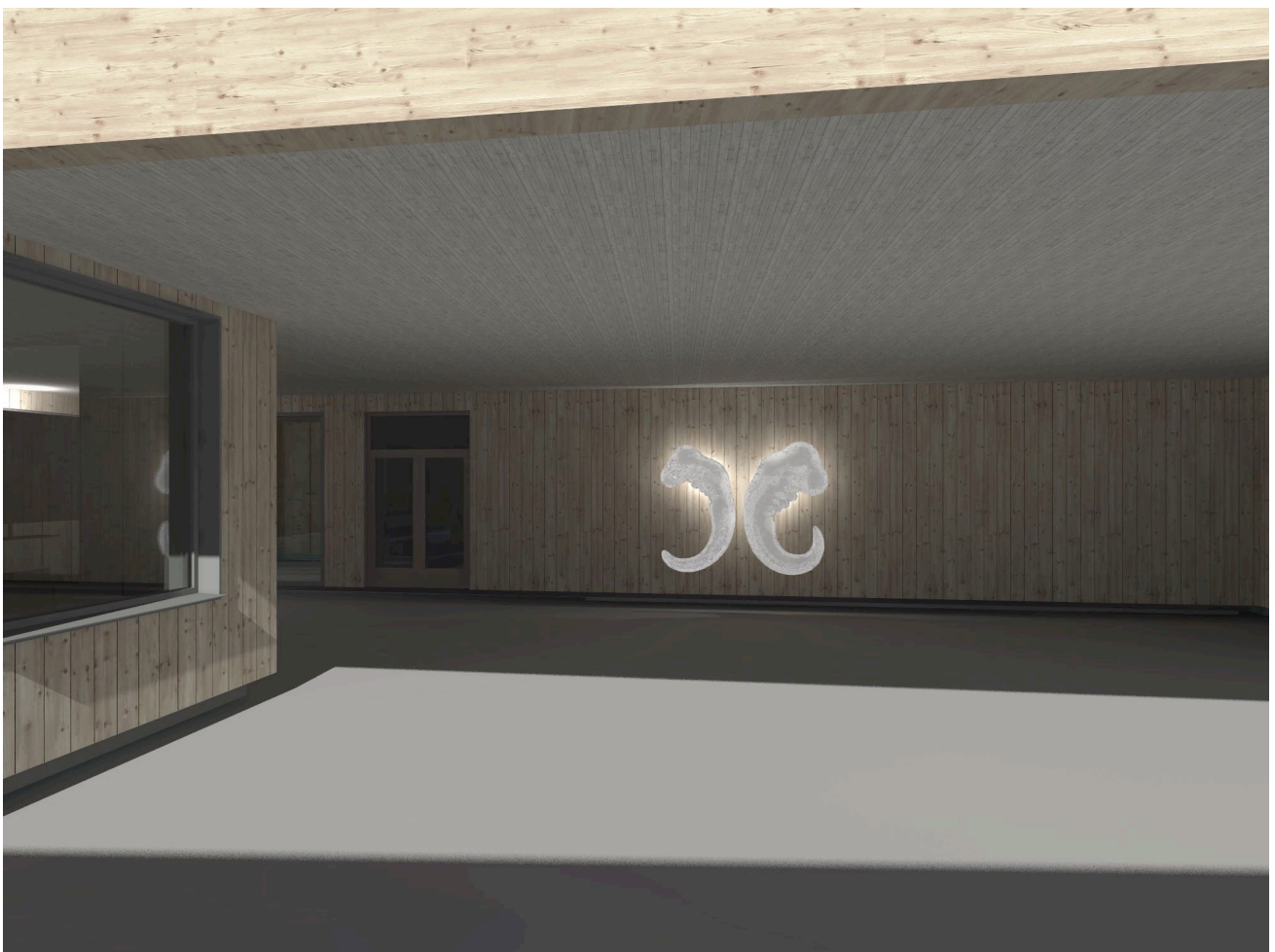
Fisk og folk, glassfiber og epoxy, RGB LED-belysning

Dette urgamle slektskapet kommer til syne i Fisk og folk . Likhetene under det tidligste fosterstadiet i utviklingen av embryo.