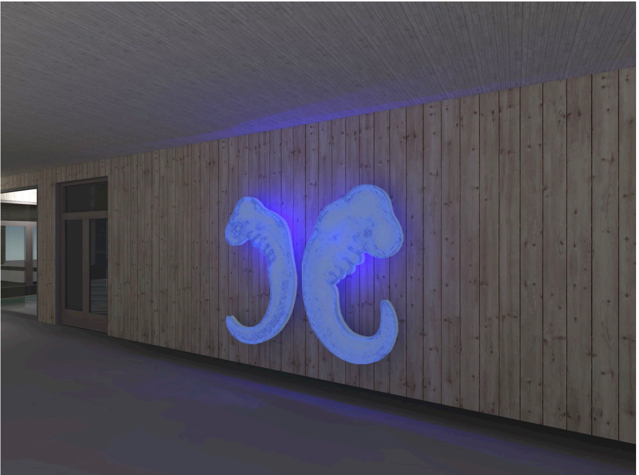
Fisk og folk, glassfiber og epoxy, RGB LED-belysning